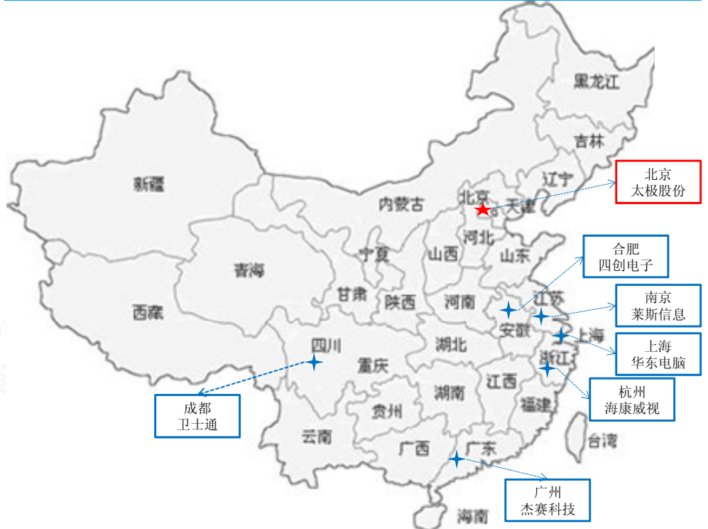
图表 2: 太极是中国电科集团在高端软件与服务百亿战略目标的承接者